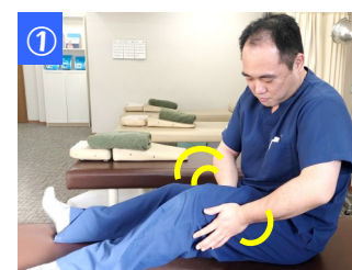
足を両手で挟んで太ももからふくらはぎまでゆっくりゆする(少し痛いぐらいはさむ)